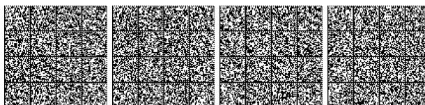
Tabella 2: Misure gestionali per il livello di prestazione 2